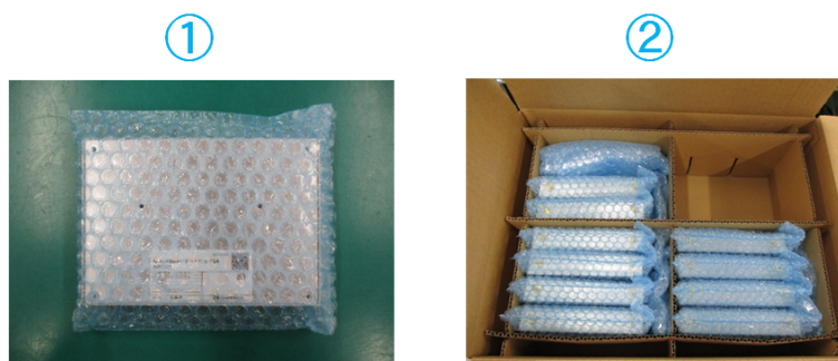
図 3.1 バルク梱包(ケースあり)の例