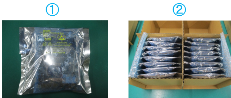
図 3.2 バルク梱包(ケースなし)の例