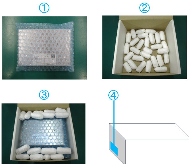
図 3.3 リテール梱包(ケースあり)の例