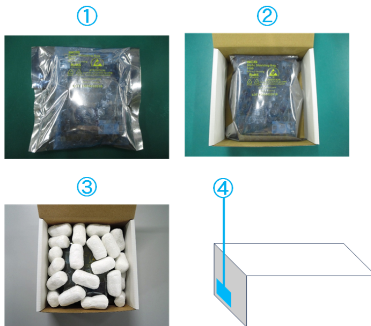
図 3.4 リテール梱包(ケースなし)の例